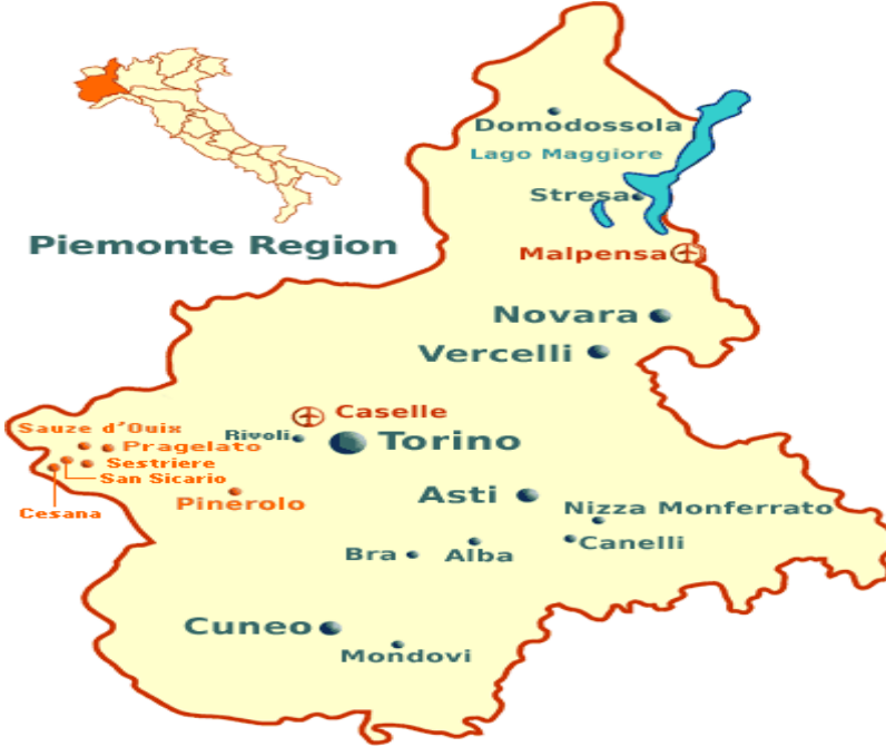
Şekil 2. Piyemento Bölgesi ve Bra Kent Haritası("Trip Savvy", 2021).

İtalya Cumhuriyeti'nin beşi özel statülü, onbeşi olağan statülü olmak üzere toplamda yirmi bölgesi bulunmaktadır. 1960'lı yıllardan sonra bölge yönetimlerine idari ve mali olarak daha çok yetki veren merkezi hükümet yerleşmeye yönelik çalışmalar yapmaya devam etmiştir.