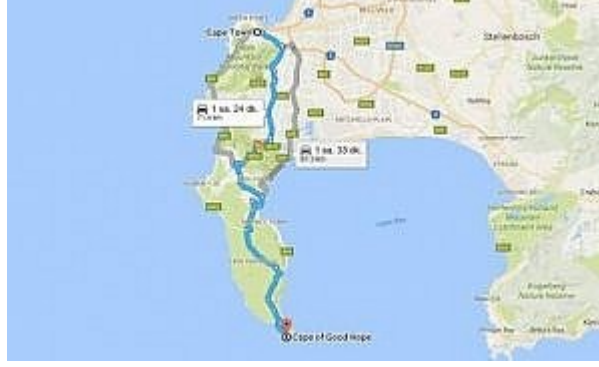
Şekil 2 Ümit Burnu

Portekizli denizci Bartelemeo Diaz ise 1486 yılında tutulduğu bir fırtınayla güneye sürüklenerek Natal'e ulaştı. Afrika'nın güneyinden dolanarak 1487 yılında Ümit Burnu'nu keşfeden denizci buraya Fırtınalar Burnu adını vermişti. 1498 yılına gelindiğinde ise Vasco De Gama Hint Okyanusu'nu aşarak Hindistan'ın batı kıyılarına ulaşmıştı.